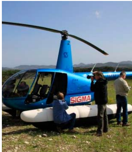
DANYEL ANDRÉ LUFTBILDER

le verpflichten konnte, vermittelt den Teilnehmern hochkarätiges Profiwissen aus dem Bereich der Personenfotografie. Mit drei Models und einer Visagistin gibt es natürlich reichlich Gelegenheiten, um das Gelernte in die Praxis umzusetzen.