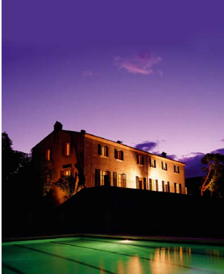
Das Landhotel Carrossa liegt im Nordosten der Insel Mallorca, nahe dem malerischen Städtchen Artá

Der Erfolg der großen Foto-Sommerschule, die FOTO HITS und SIGMA letzten Herbst im mallorquinischen Landhotel Carrossa veranstalteten, rief nach einer Wiederholung. Im Juni geht es in die zweite Runde, und wieder stehen Themen von Akt bis zur Luftfotografie aus dem Helikopter auf dem Programm.