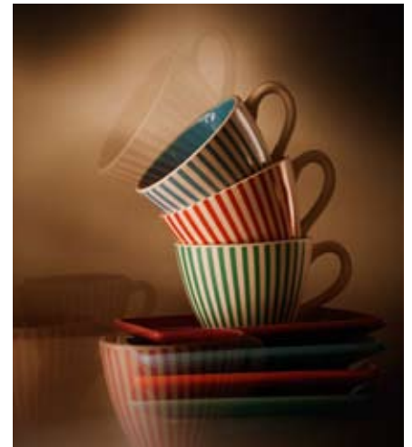
EBERHARD SCHUY STILLS & LANDSCHAFT

Programm. Zuvor wird der Fotograf und Luftbildexperte und Mallorca-Kener Danyel André auch in diesem Jahr wieder eine Einführung in das Fotografieren aus der Luft geben, so dass erneut mit spektakulären Bildergebnissen zu rechnen ist.